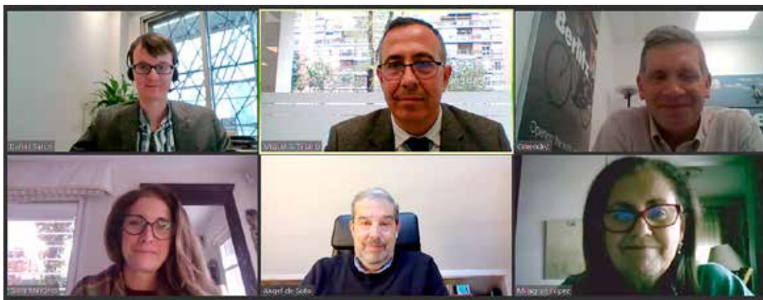
Imagen de la Junta Directiva del 30 de marzo que se desarrolló a través de Zoom.

ACEDIM, la Asociación de centros privados de enseñanza de Idiomas en la comunidad de Madrid, representa y defiende los intereses academias de idiomas que están ubicadas en la comunidad madrileña.